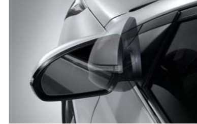
مرابا قابلة للطي آلياً