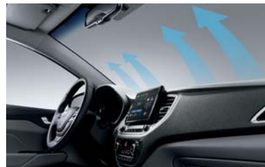
مزبل الضباب عن النوافذ