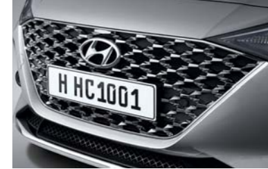
شبك مطلي بالكروم بتصميم بارامتري