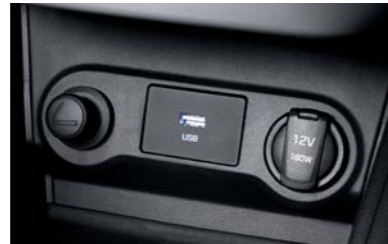
منافذ التوصيل USB ومأخذ قدرة 12 فولت