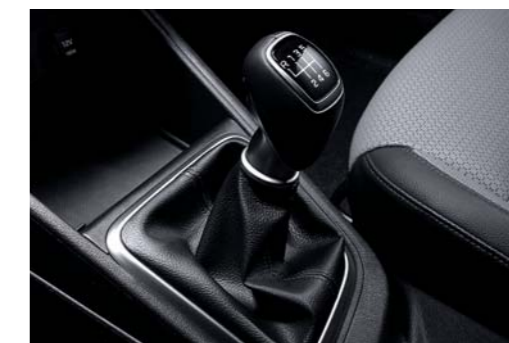
ناقل حركة يدوي ذو 6 سرعات

لكي تضمن توفير أقصى قدر من الكبح، فقد تم تجهيز سيارة أكسنت بمكابح قرصية أمامية مفاص 14 بوصة، ومعزز للمكابح المفرغة ونظام مكابح مانع للانغلاق.