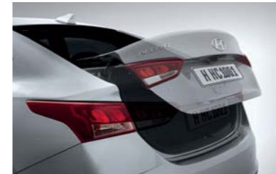
صندوق خلفي بمزايا ذكية