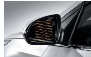
مرابا جانبية قابلة للتدفئة