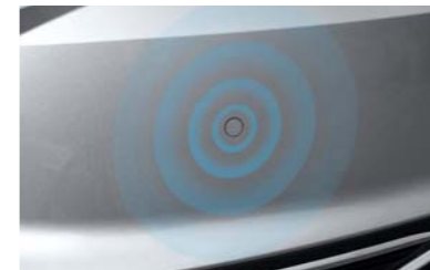
نظام مساعدة ركن السيارة