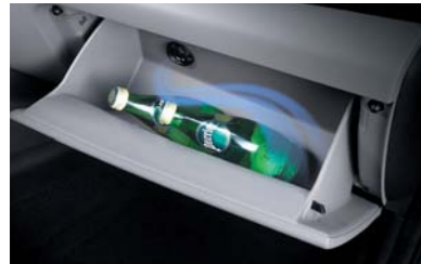
صندوق اللوازم مع نظام تبريد