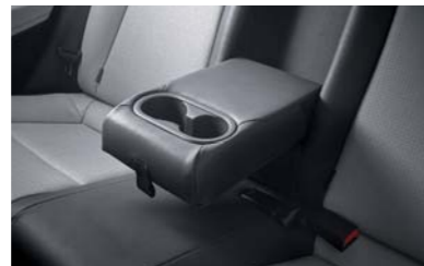
مسند يد خلفي مع حاملة أكواب