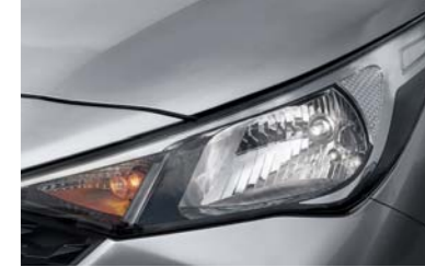
مصابيح أمامية هالوجين