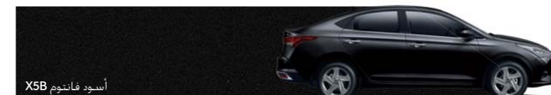
أسود فانتوم X5B