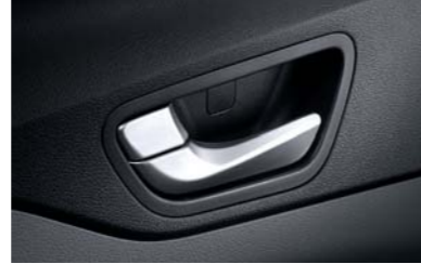
مقابض الأبواب الداخلية مطلية بالكروم