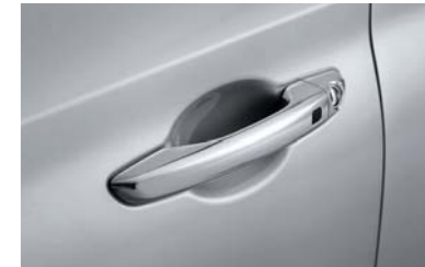
مقابض الأبواب مطلية بالكروم