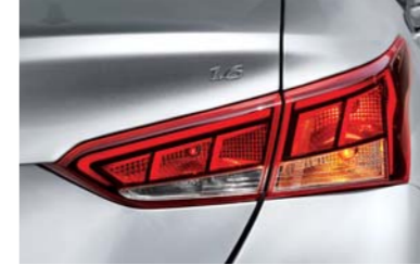
مجموعة مصابيح خلفية من نوع اللمبة