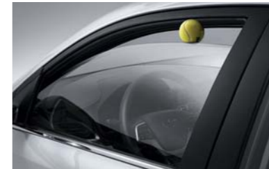
نوافذ بخاصية التوقف الآلي للسلامة