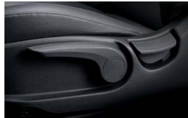
ميزة ضبط ارتفاع مقعد السائق