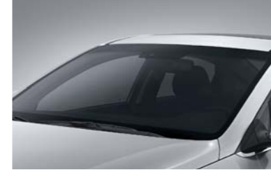
زجاج حاجب لأشعة الشمس