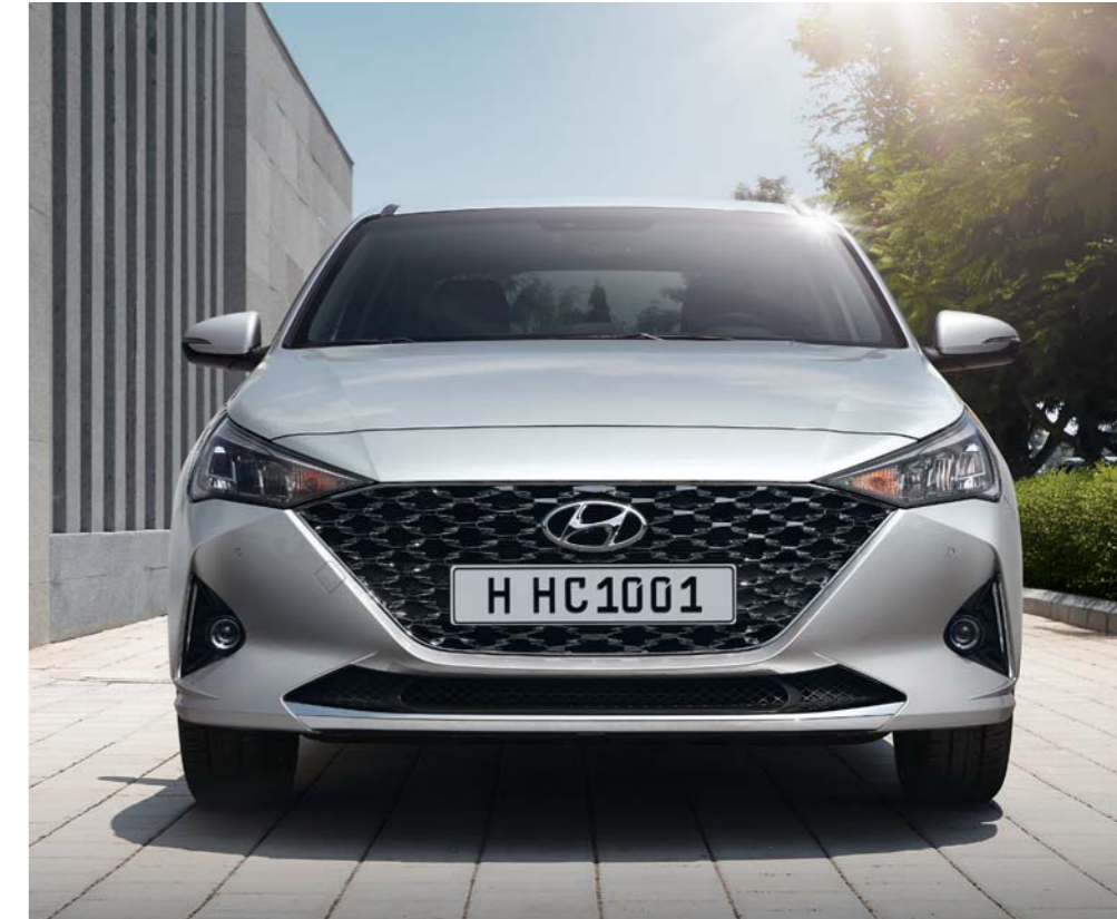
تصميم أمامي يتيح دوران الهواء وشبك بتصميم بارامتري