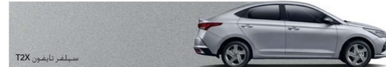
سيلفر تايفون T2X