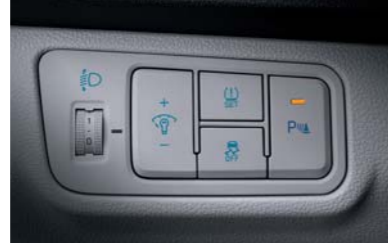
نظام ثبات إلكتروني يعمل كهربائياً