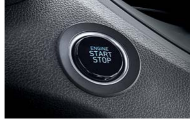
زر تشغيل يعمل بالكبس/المفتاح الذكي