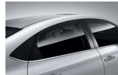
قوالب من الكروم المطور