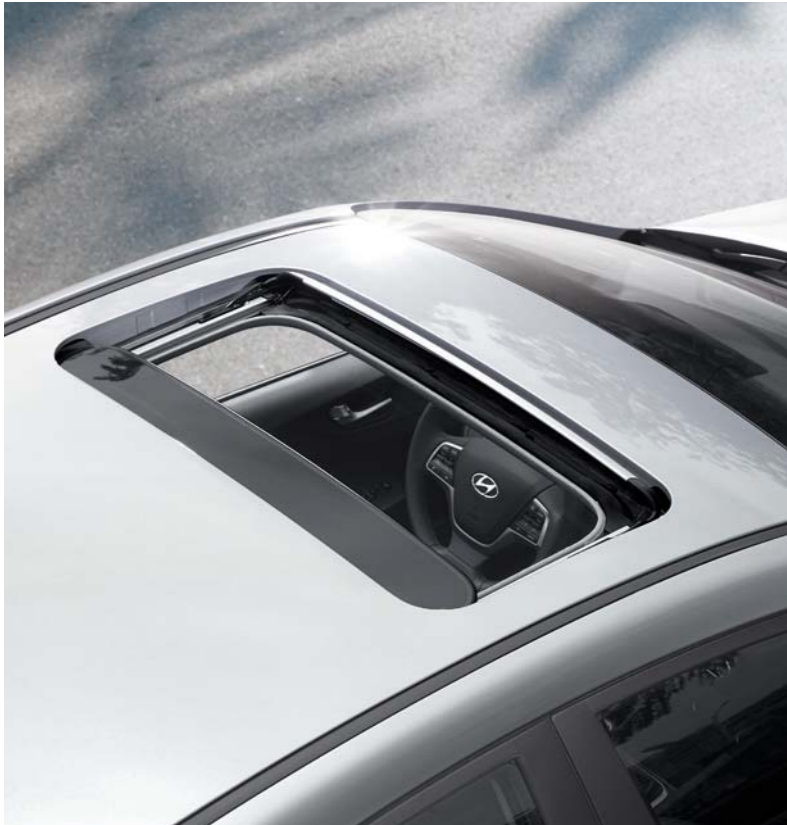
فتحة سقف كهربائية