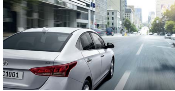
نظام تثبيت السرعة ألياً

فور دخولك سيارة أكسنت، سيعمرك شعور رائع بالحماية والأمان... لا شك أن هذا أكثر من مجرد شعور عابر، إنها حقيقة تكشف عنها هذه السيارة الوائقة. بفضل تقنيات السلامة المتطورة في صناعة السيارات اليوم، توفر سيارة أكسنت أقصى درجات الحماية والسلامة لك وللركاب الآخرين.