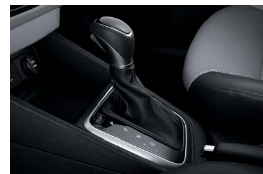
ناقل حركة أوتوماتيكي ذو 6 سرعات

يعد هذا الناقل الاختيار المثالي والملائم للسائقين الذين يضعون الاقتصادية في قائمتهم أولوياتهم، تتميز حركة الفايض بالنسولة والانسيابية، وتوفر مستوى فريداً من السلاسة والراحة أثناء التنقل بين السرعات.