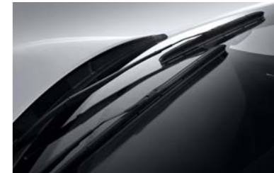
مشاحات زجاج من Aero