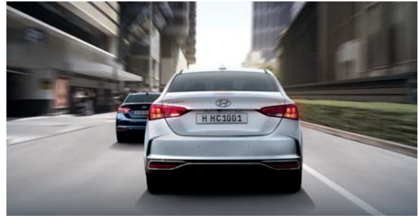
إشارة التوقف الطارئ

بإمكان السائق ضبط السرعة المطلوبة وسوف تنقل الميزة التلقائية نظام التحكم في السرعة إلى المستوى التالي، من خلال الكبح واستئناف التسارع تلقائياً، لضمان المسافة الآمنة بينه وبين السيارة في الأمام بشكل مستمر.