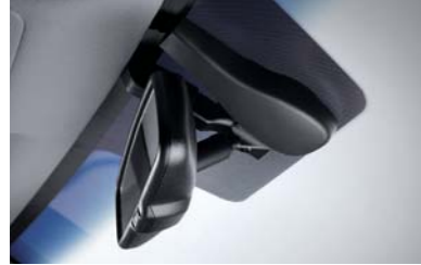
مجنس استشعار المطر

لا مزيد من البحث عن مفتاح السيارة في جيوبك أو محفظتك. بمجرد كونك تحمل المفتاح معك، فإنه يمكنك تشغيل السيارة وفتح وإقفال الأبواب والصندوق الخلفي عن بعد.