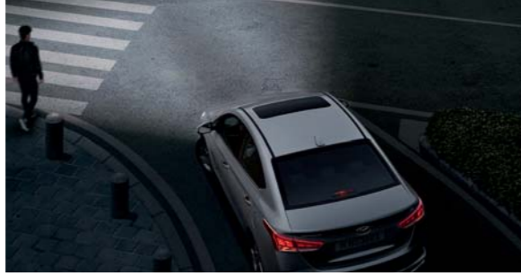
مصابيح الانحناء الثابتة

تنفرد هذه الخاصية المتطورة بالتمييز بين الكبح العادي والكبح المفاجيء، فعند الضغط على المكابح بقوة في الظروف المفاجئة والطارئة، سوف تبدأ مصابيح المكابح بالوميض تلقائياً، وبالتالي تعمل على تحذير السائقين في الخلف إلى وجود وضع خطر أمامهم.