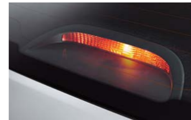
مصباح توقف مرتفع