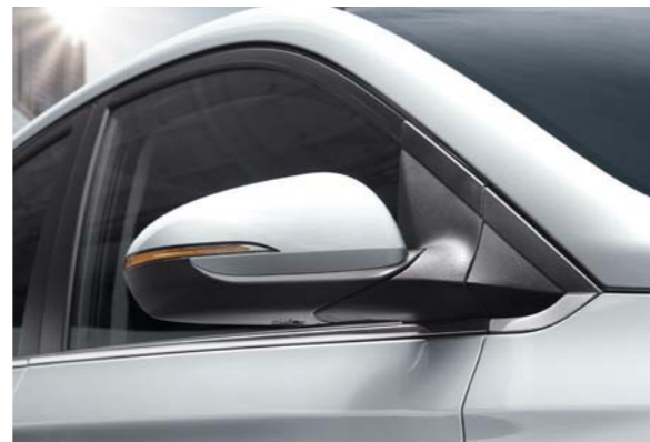
مجموعة مصابيح خلفية LED مرايا خارجية مزودة بمصابيح صغيرة