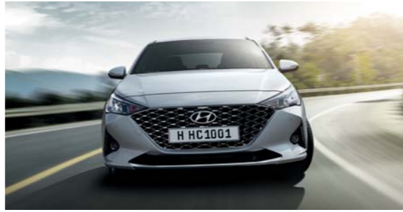
التحكم الإلكتروني بالثبات

بفضل هذا النظام بإمكان السائق والراكب الأمامي الاستمتاع بحماية وسلامة أكيدة من كافة الجوانب، حيث تتوفر وسادتان هوائيتان أماميتان، بالإضافة إلى وسادتين سنارية جانبيتين على طول المقصورة توفران الحماية للرأس، ليرتفع بذلك عدد الوسائد الإجمالي إلى ست وسائد.