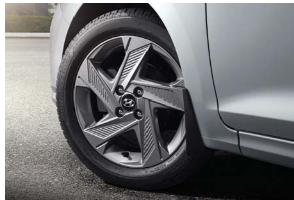
مصد خلفي بارز عجلات معدنية مقاس 16 بوصة