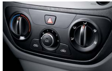
نظام تكييف هوائي يدوي