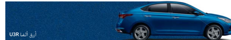
أزرق ألفا U3R