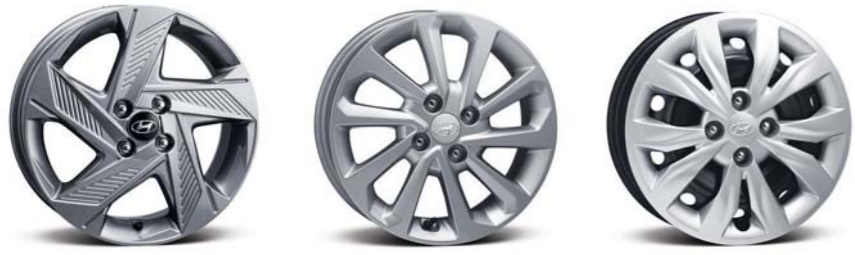
عجلات معدنية مقاس 16 بوصة