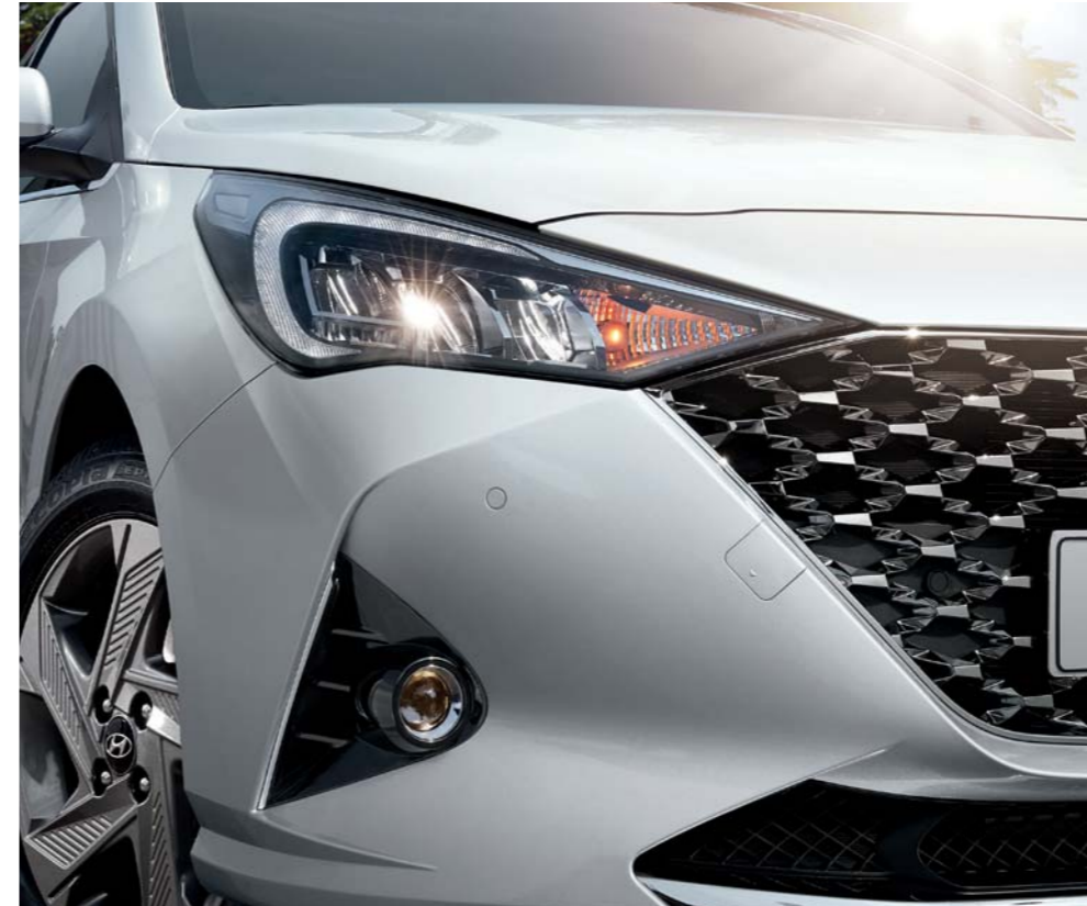
مصابيح أمامية LED مع مصابيح ضباب MFR عاكسة