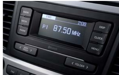
راديو + RDS