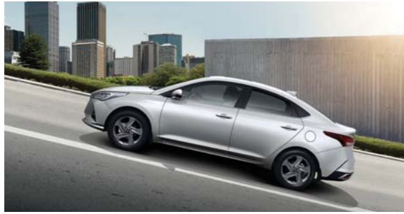
نظام تحكم للمساعدة عند المرتفعات

كتشفت هيونداي عن رباتها هذا الابتكار في سيارتها نيو س - 2 موديل 2003، والذي يستخدم دوران عجلة القيادة لتشغيل وإطفاء المصابيح المساعدة التي تضيء المناطق الجانبية المظللة غير المغطاة بإضاءة المصابيح الأمامية.