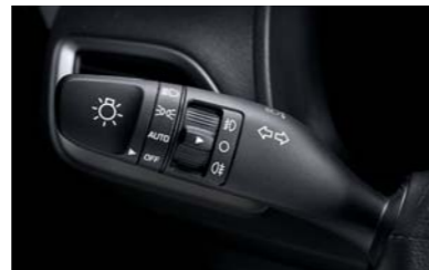
إشارة ثلاثية الحركة تعمل بلمسة واحدة