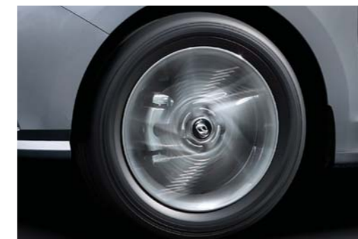
مكابح قرصية أمامية

لكي تضمن توفير أقصى قدر من الكبح، فقد تم تجهيز سيارة أكسنت بمكابح قرصية أمامية مفاص 14 بوصة، ومعزز للمكابح المفرغة ونظام مكابح مانع للانغلاق.