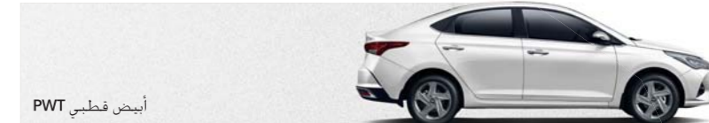
أبيض قطبي PWT