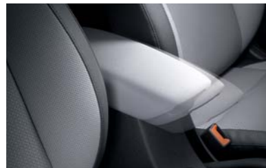
كونسول وسطي قابل للترلق