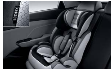
نظام تثبيت مقعد الطفل