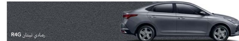
رمادي تيتان R4G