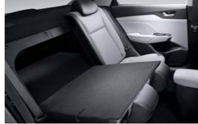
نظام طي المقعد (نوع 60:40)