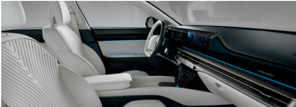
Indigo/Light gray two-tone