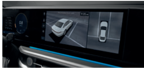
Surround View Monitor (SVM)