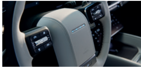
Interactive Pixel Lights