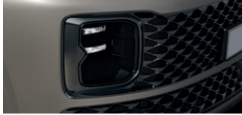
Dual LED Projection Head Lamps