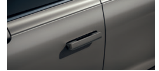
Auto Flash Door Handle