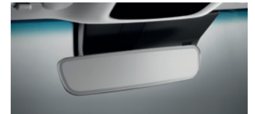
Bezel-less Inside Mirror