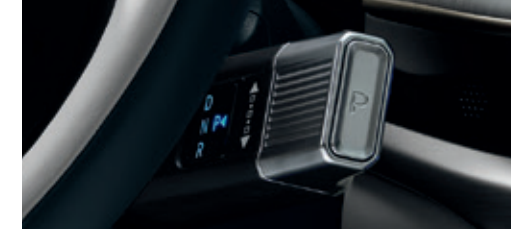
Column-Type Shift by Wire (SBW)