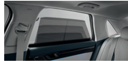
Power Rear Side window Sunshade