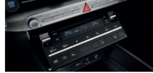
Dual Full Auto Air Conditioner ( Button-Type)