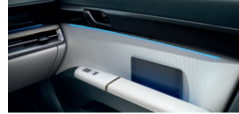
Door Trim Space