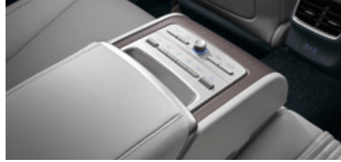
Rear Seat Center Console Armrest